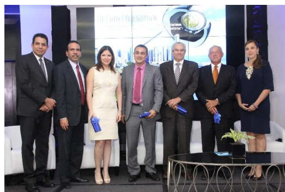
Vista del grupo de panelistas que representaron a los sujetos obligados financieros y no financieros.