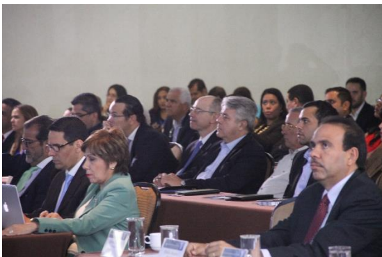
Parte de la concurrencia a el III FORO de la APEDE.

Por voz del Presidente de ASAJA, los asistentes pudieron enterarse de la transparencia que hay en la industria con respecto al manejo de efectivo, y las condiciones de manejo del mismo, que no permiten el blanqueo de capitales en dicha industria en Panamá.